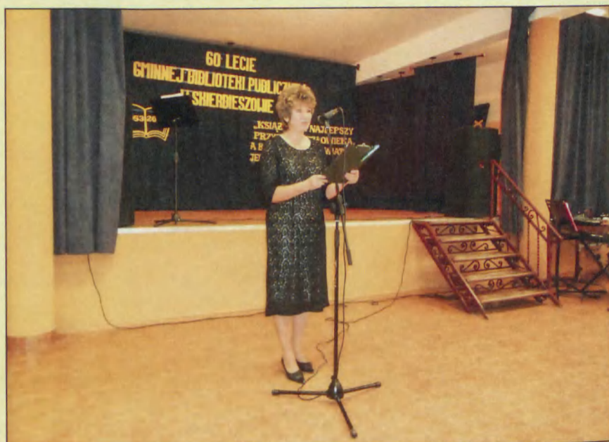
Uroczystości jubileuszowe w GBP w Skierbieszowie, 17 X 2013 r.