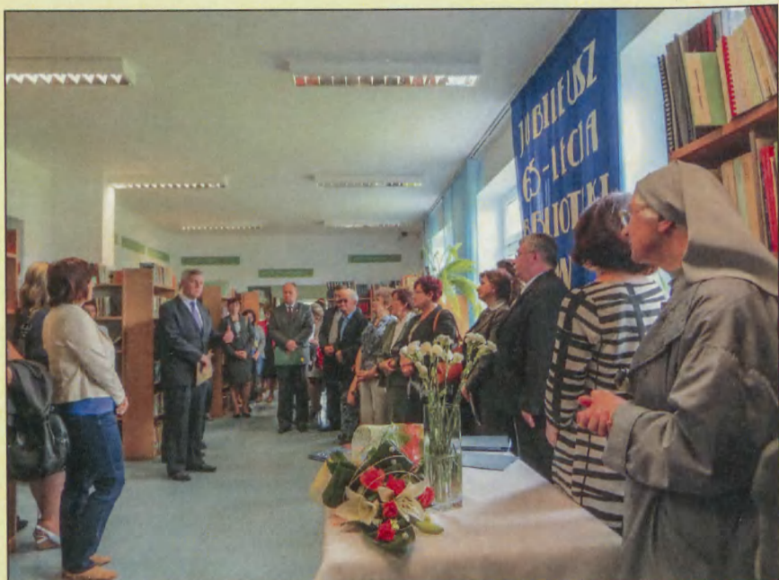
Uroczystości jubileuszowe w BPG Łąbnie, 6 VI 2013 r.