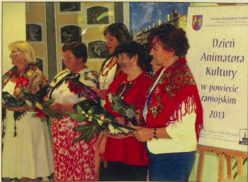
Dzień Animatora Kultury w powiecie zamojskim, 13 VI 2013 r.