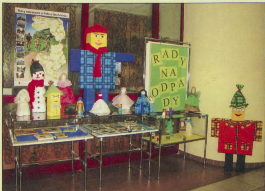
Wystawa o tematyce ekologicznej w Książnicy Zamojskiej, listopad 2013 r.