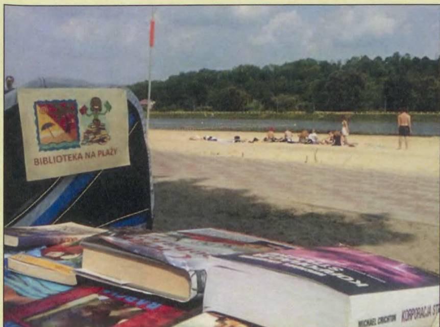
Akcja czytelnicza MGBP w Krasnobrodzie, lipiec - sierpień 2013 r.